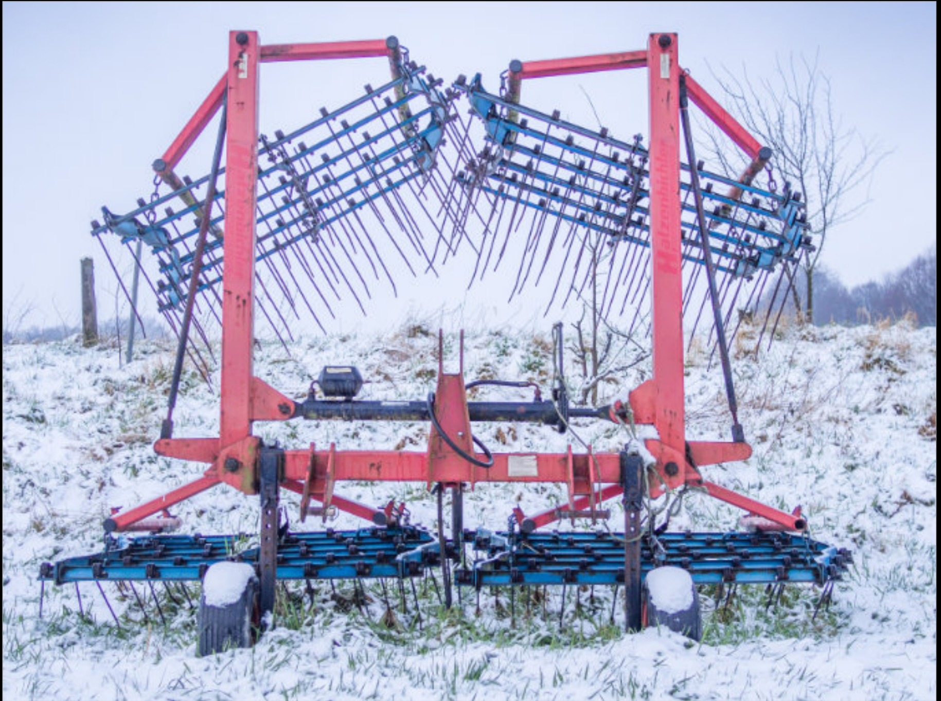
Striegel (landwirtschaftliches Gerät) am Köckerhof