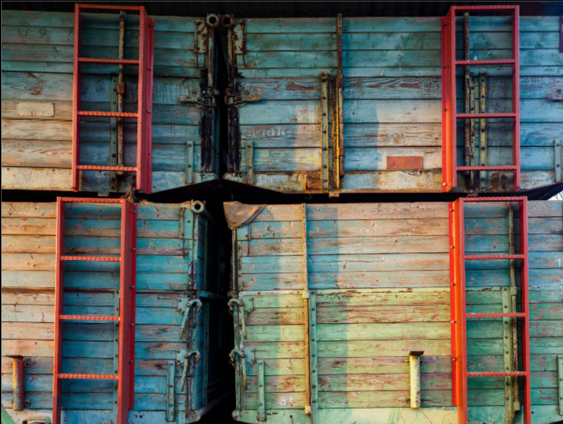
Traktoren-Anhänger auf dem Gelände des Biolandbetriebs „Köckerhof“