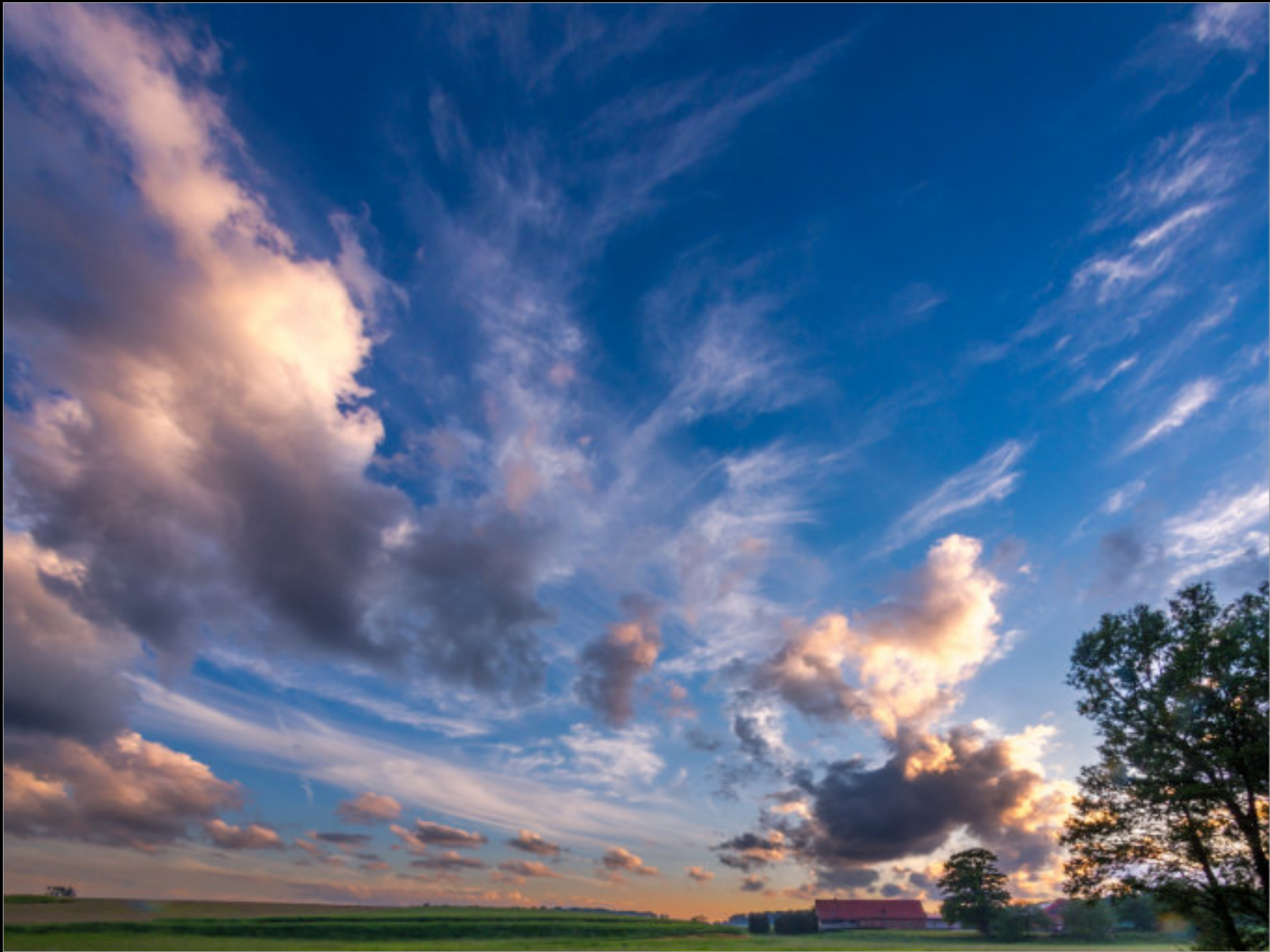
Bauernhof im Mühlenbachtal