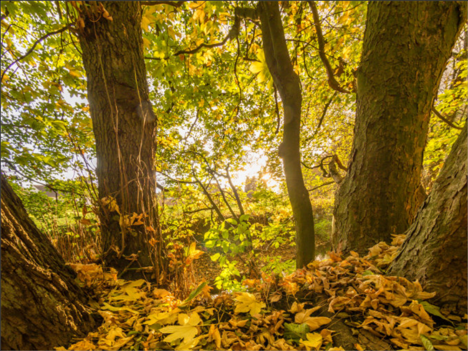
Beidseitig: Herbst am Schwarzbach Im Naturschutzgebiet Mühlenmasch