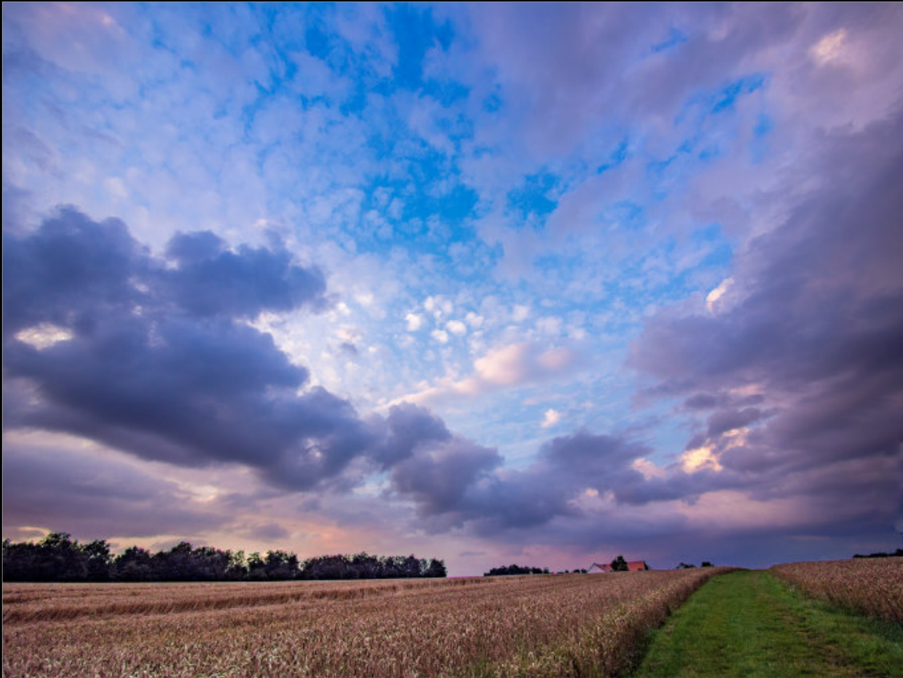
Schäfchenwolken über einer abziehenden Regenfront