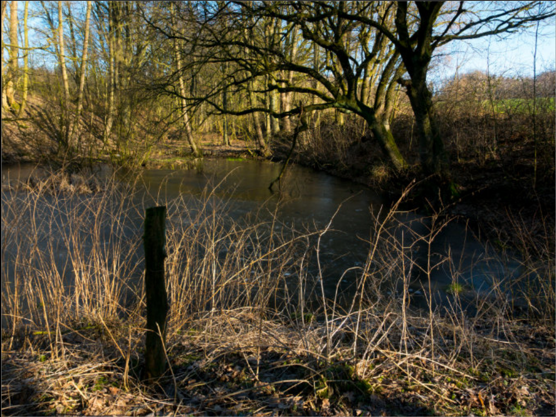
Beidseitig: Alter Bauernteich