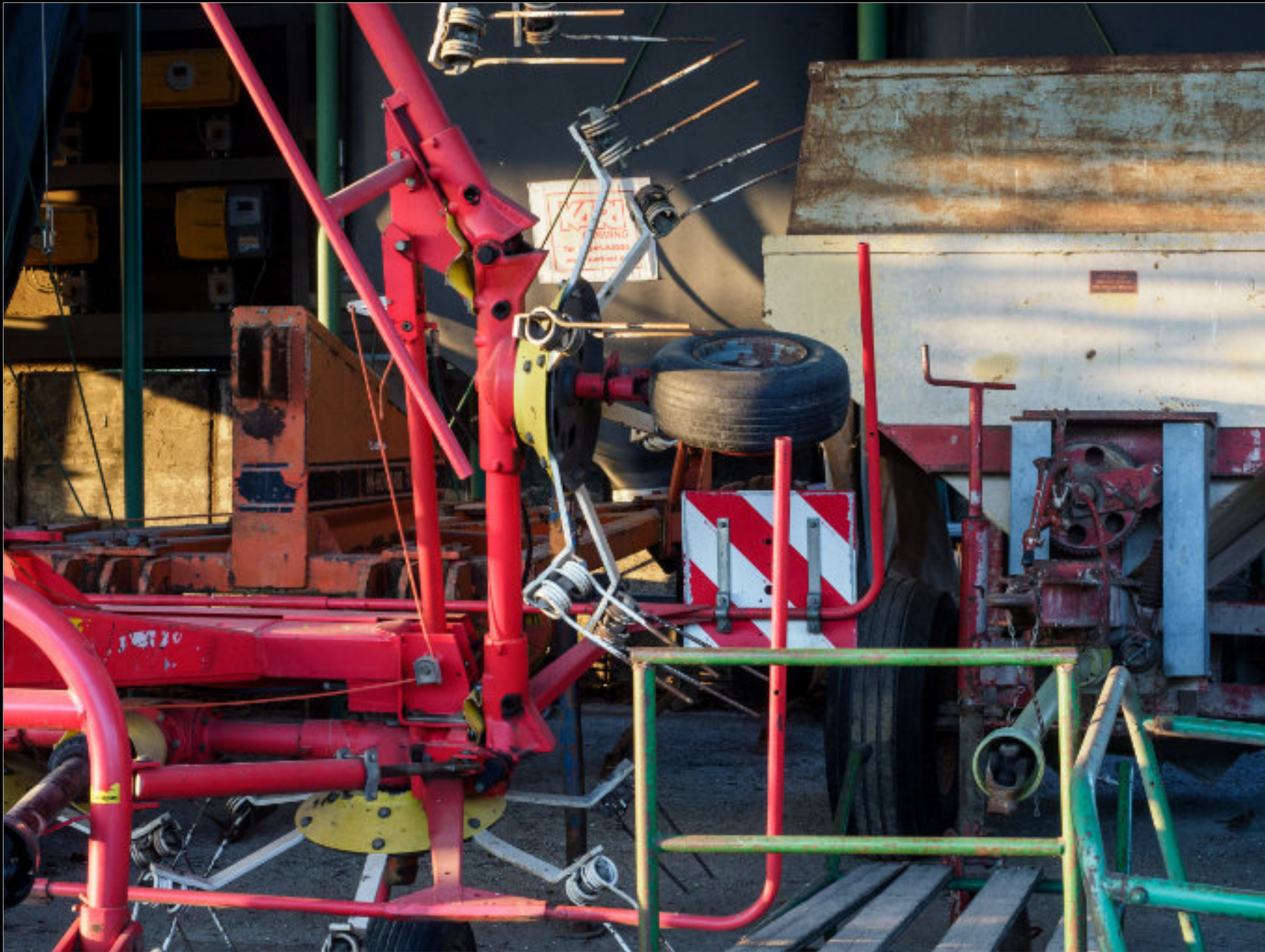
Beidseitig: Landwirtschaftliches Gerät, Stroh und Baumaterial am Köckerhof