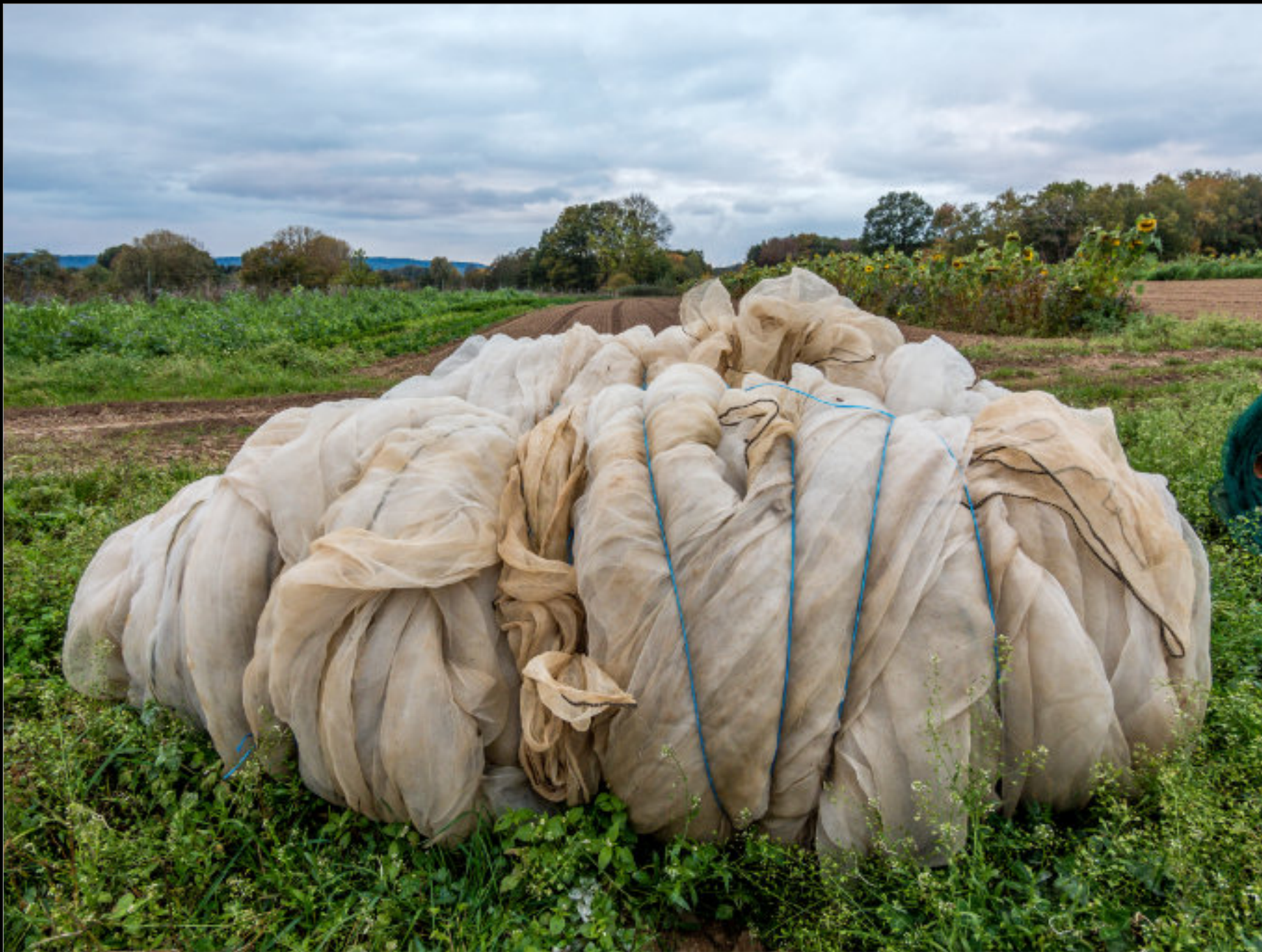
Ende der Saison – zusammengerollte Schutznetze für den biologischen Gemüseanbau