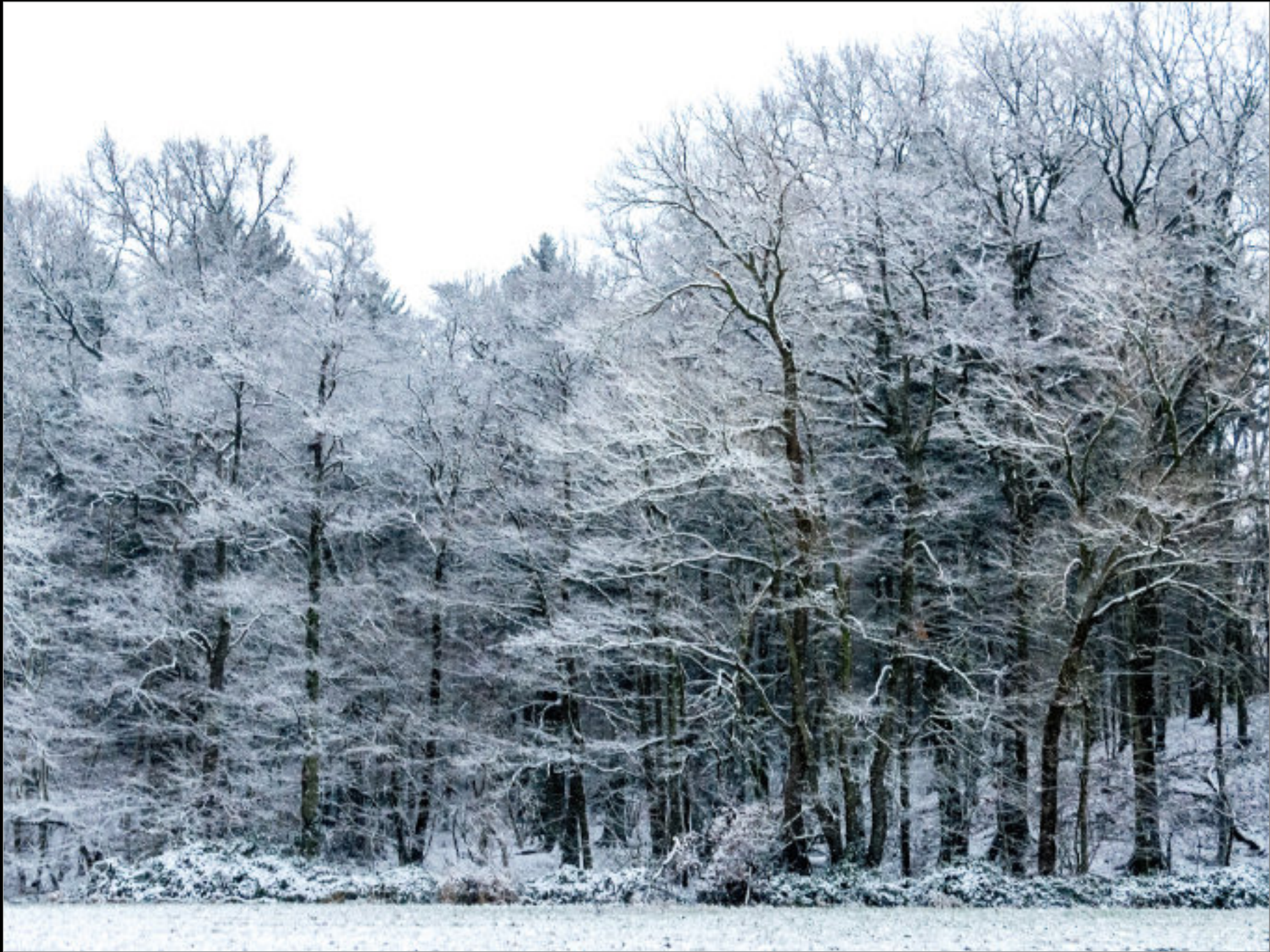
Verschneite Buchen am Waldrand