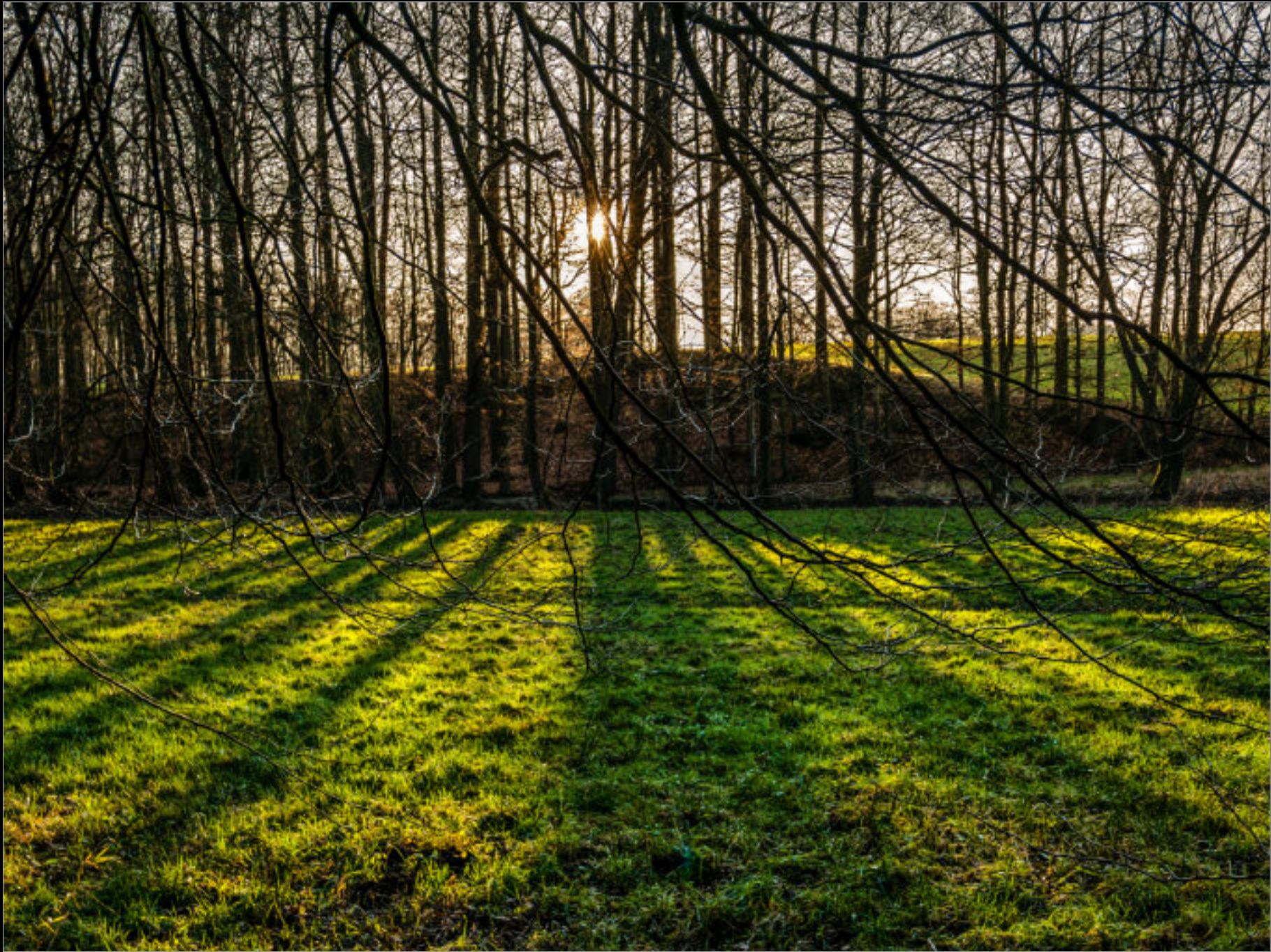
Tiefstehende Sonne am Mühlenbachtal