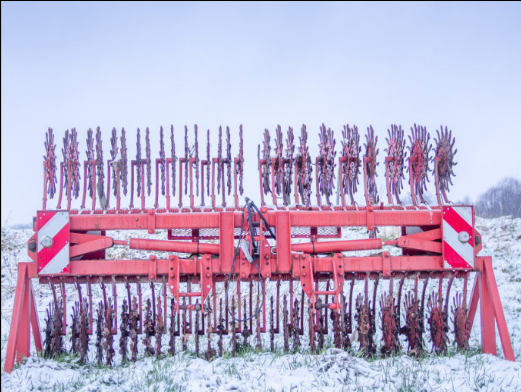
Grubber-Walze (landwirtschaftliches Gerät zur Bodenlockerung) am Köckerhof