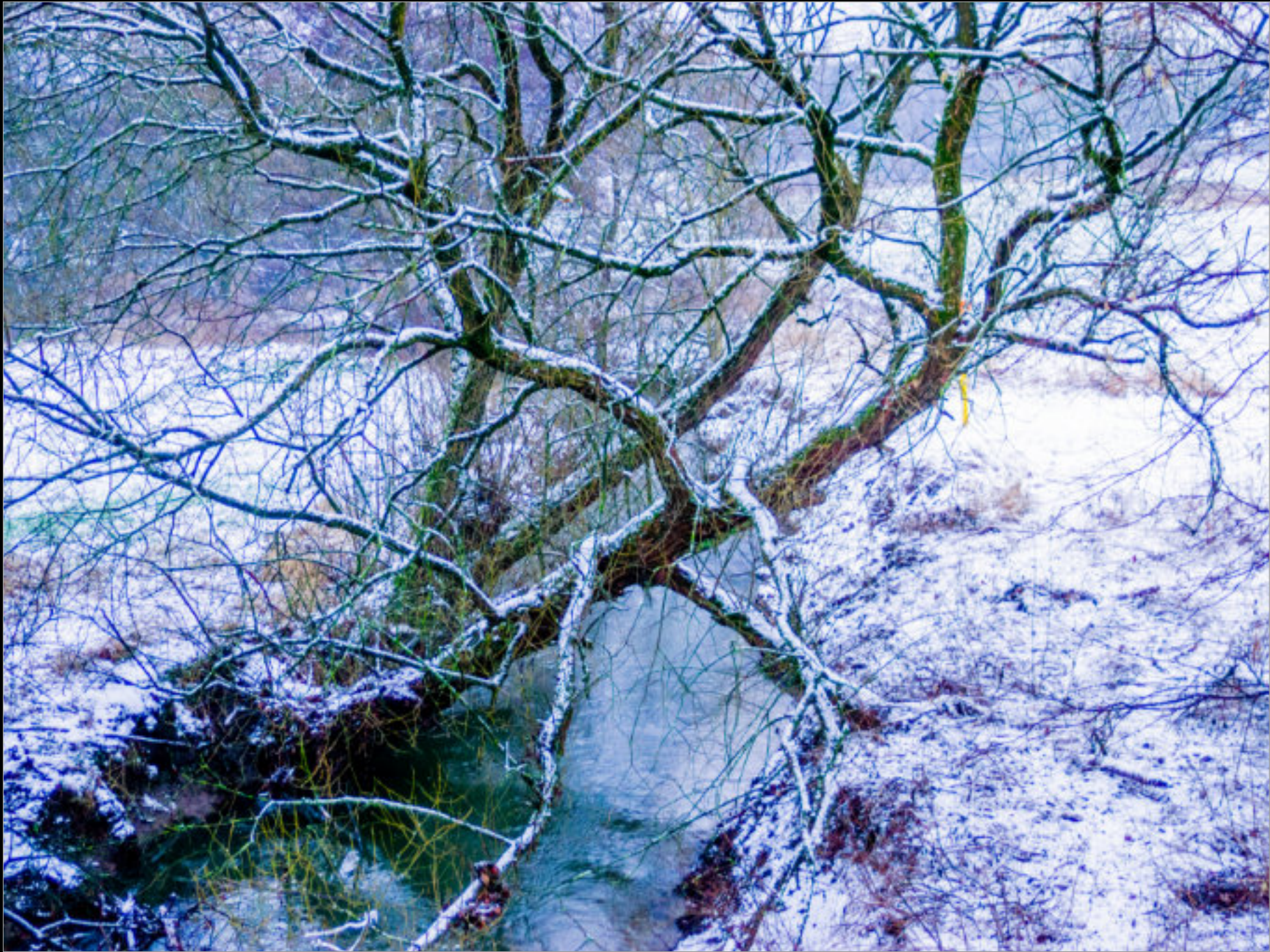
Weidenbaum über dem Johannsbach