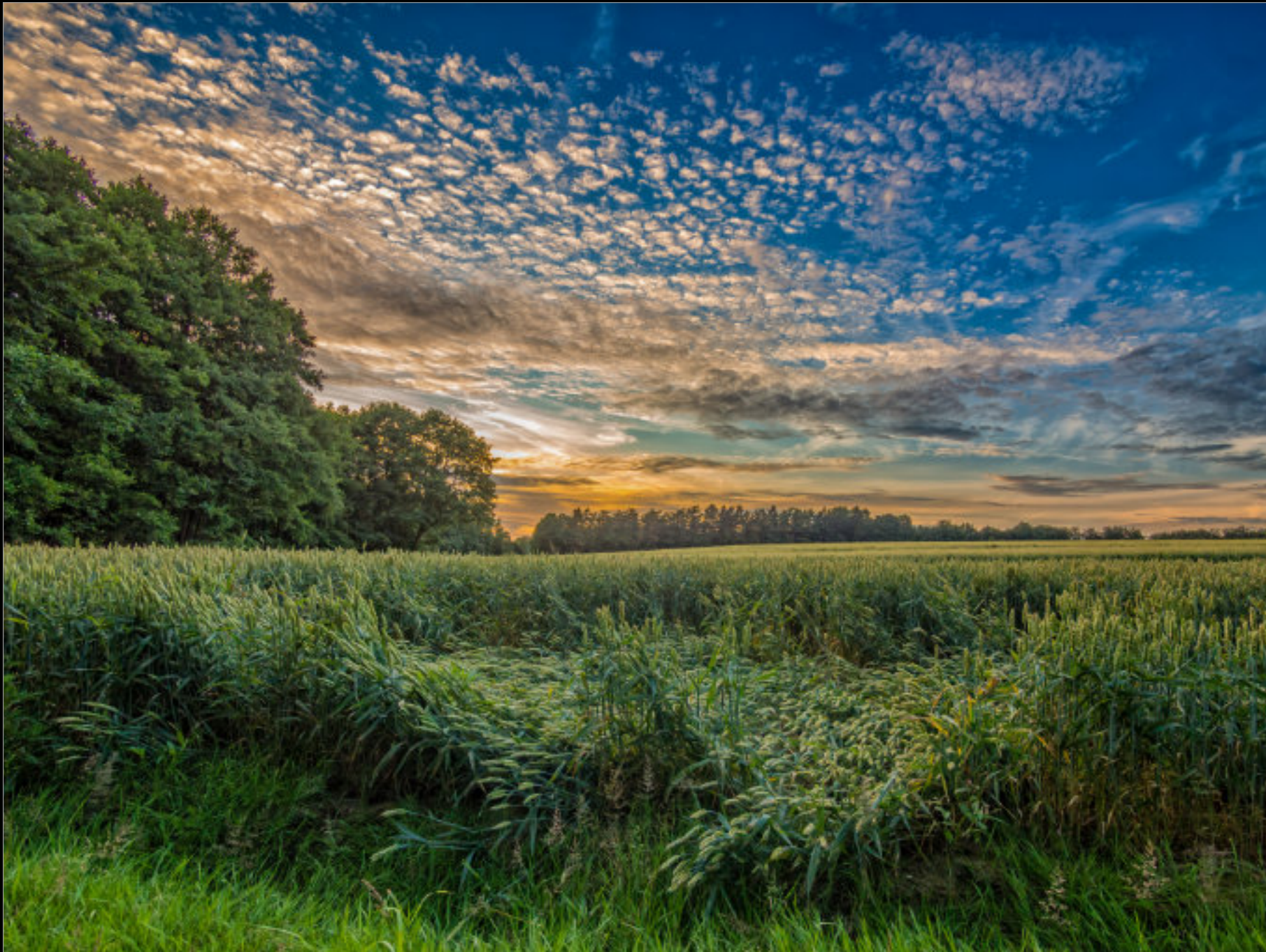
Regen hat Teile eines Weizenfeldes im konventionellen Anbau plattgedrückt