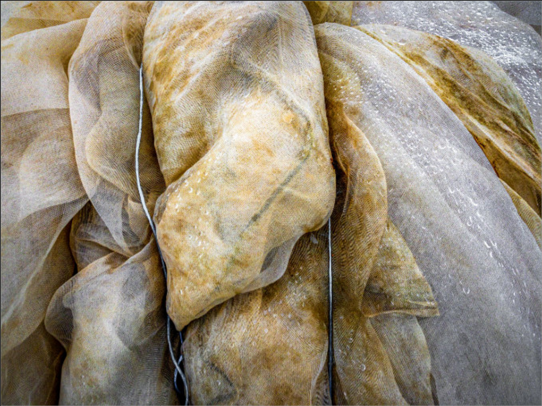
Beidseitig: Schutznetze für den biologischen Gemüseanbau