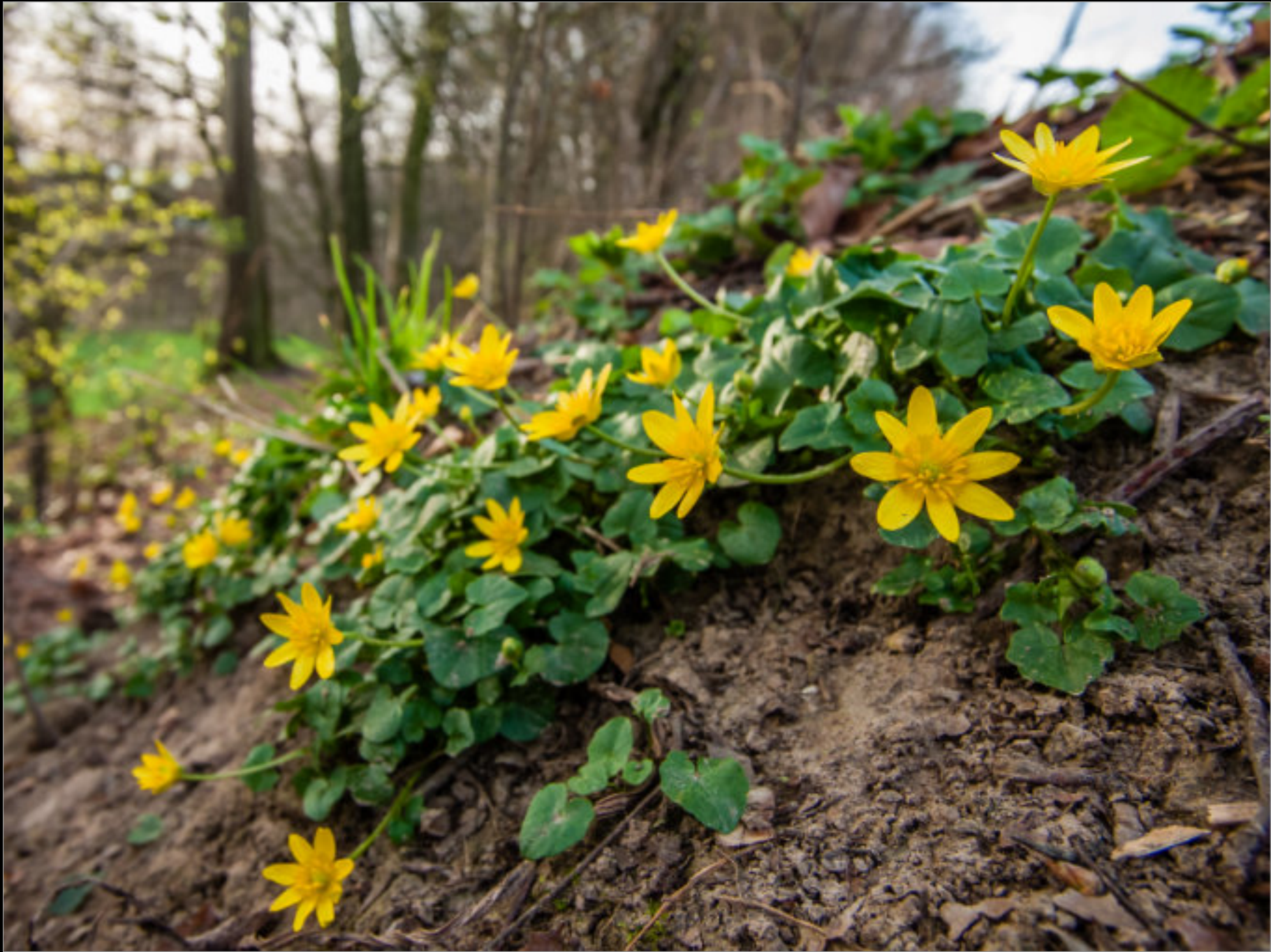
Scharbockskraut ( Ficaria verna )