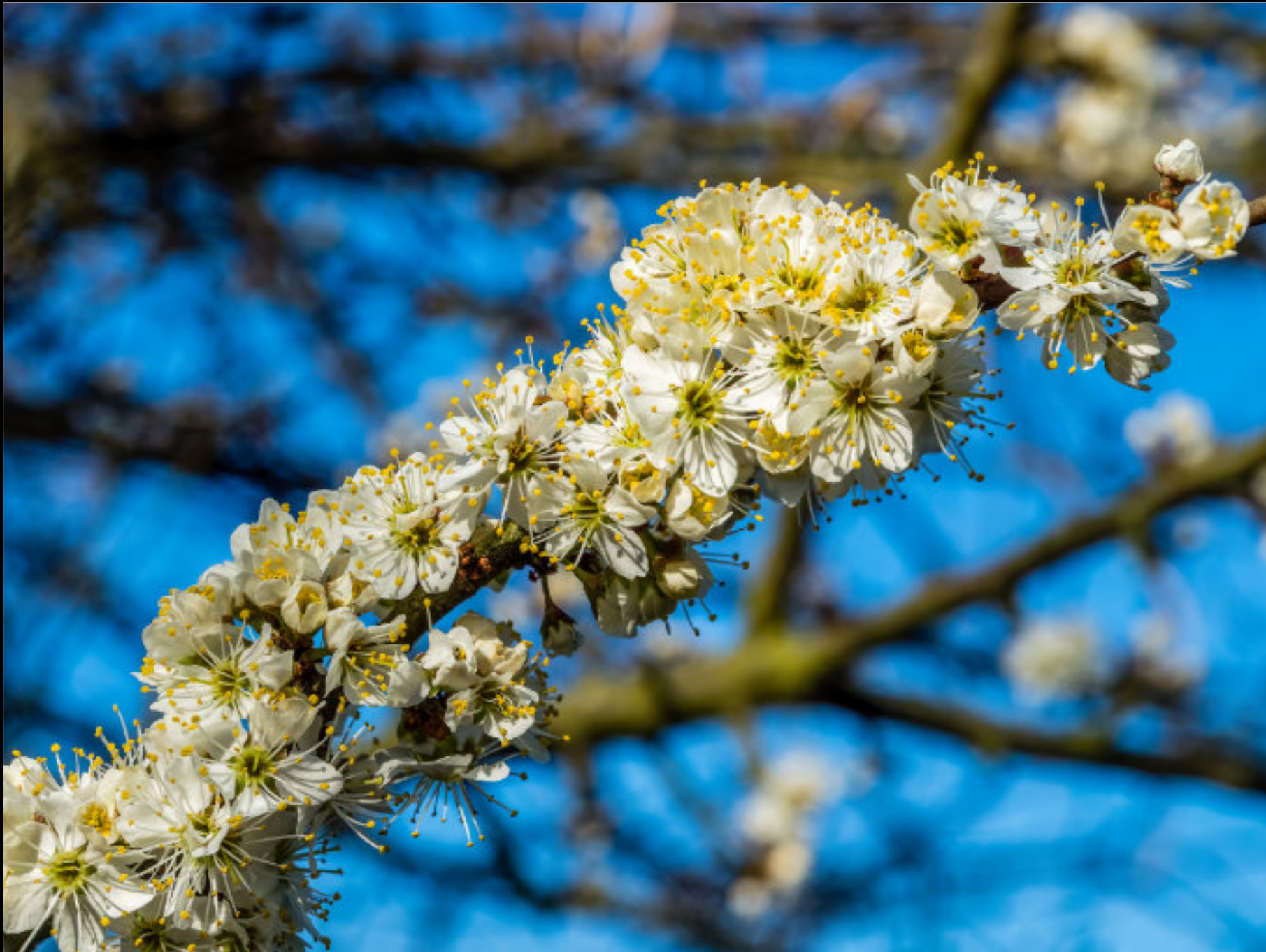
Beidseitig: Der Schlehdorn bildet dichte Hecken, schon zeitig im Frühjahr eine gute Bienennahrung