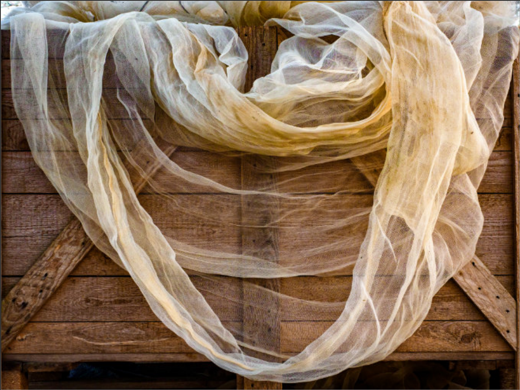
Beidseitig: Schutznetze für den Gemüseanbau auf dem Biolandbetrieb „Köckerhof“