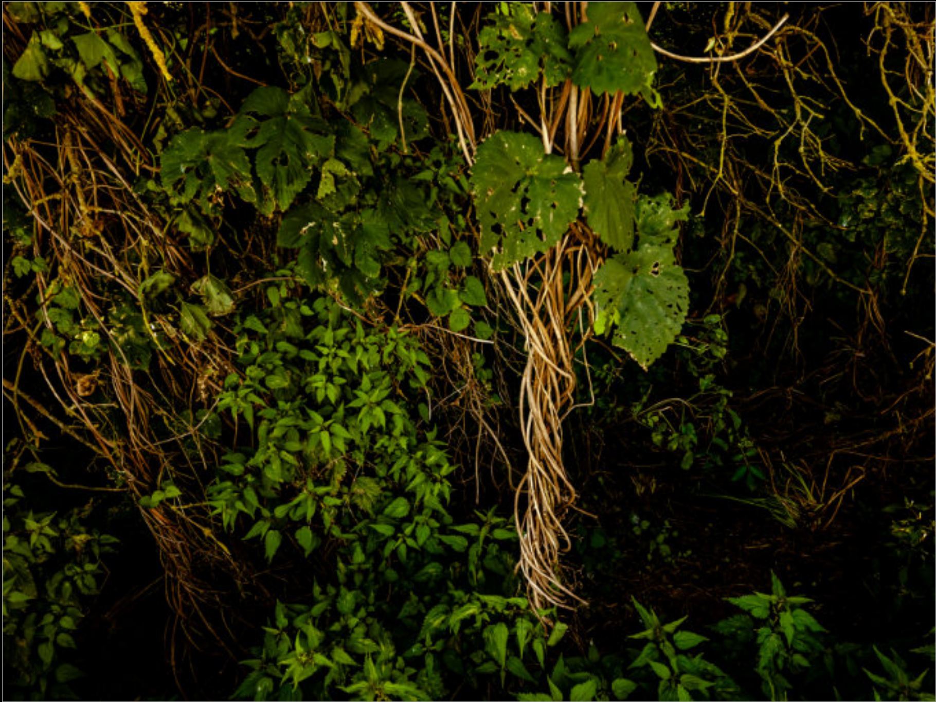
Waldrebe und Holunder bilden eine Hecke