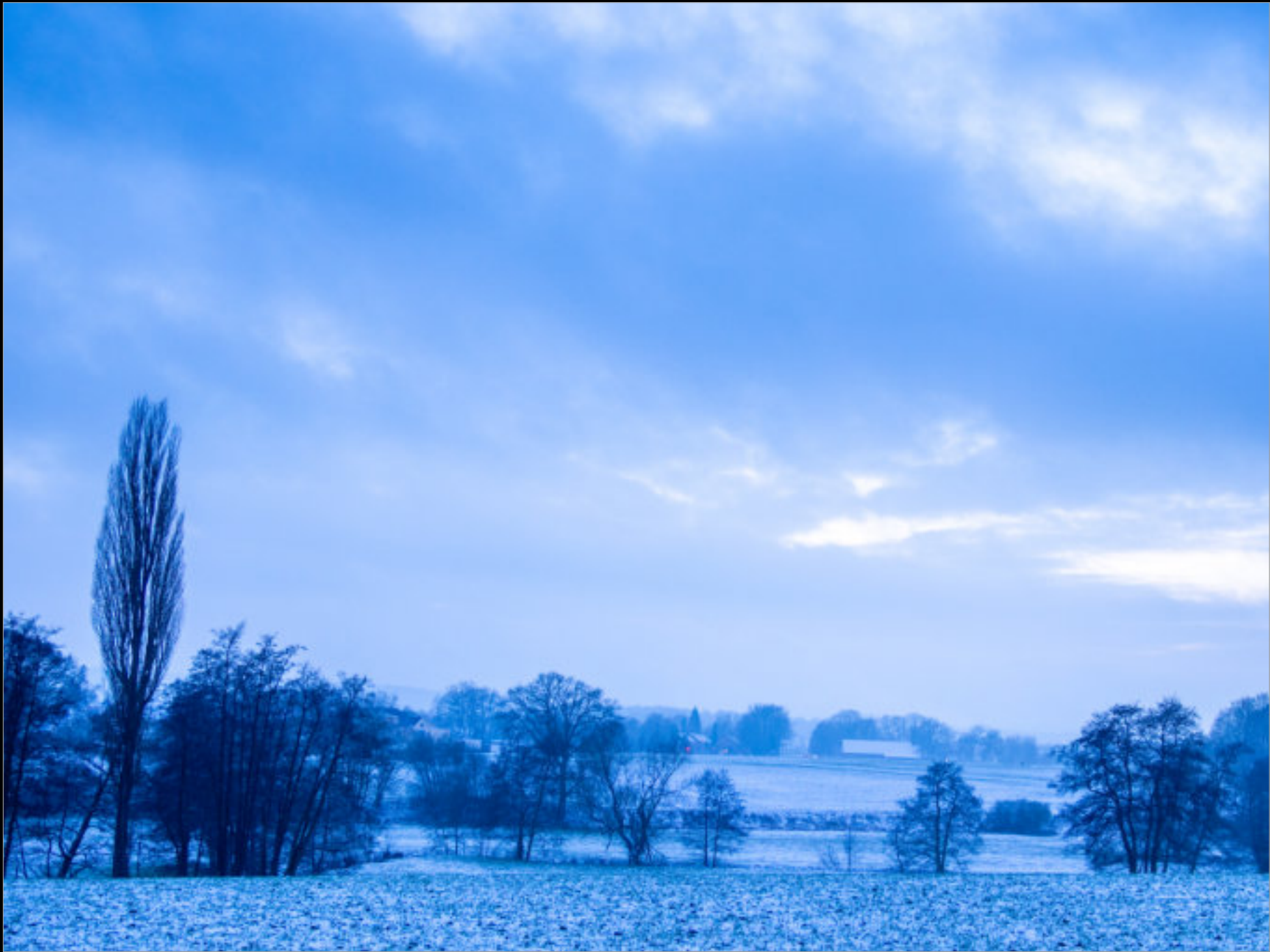
Winterlicher Blick Richtung Bielefeld