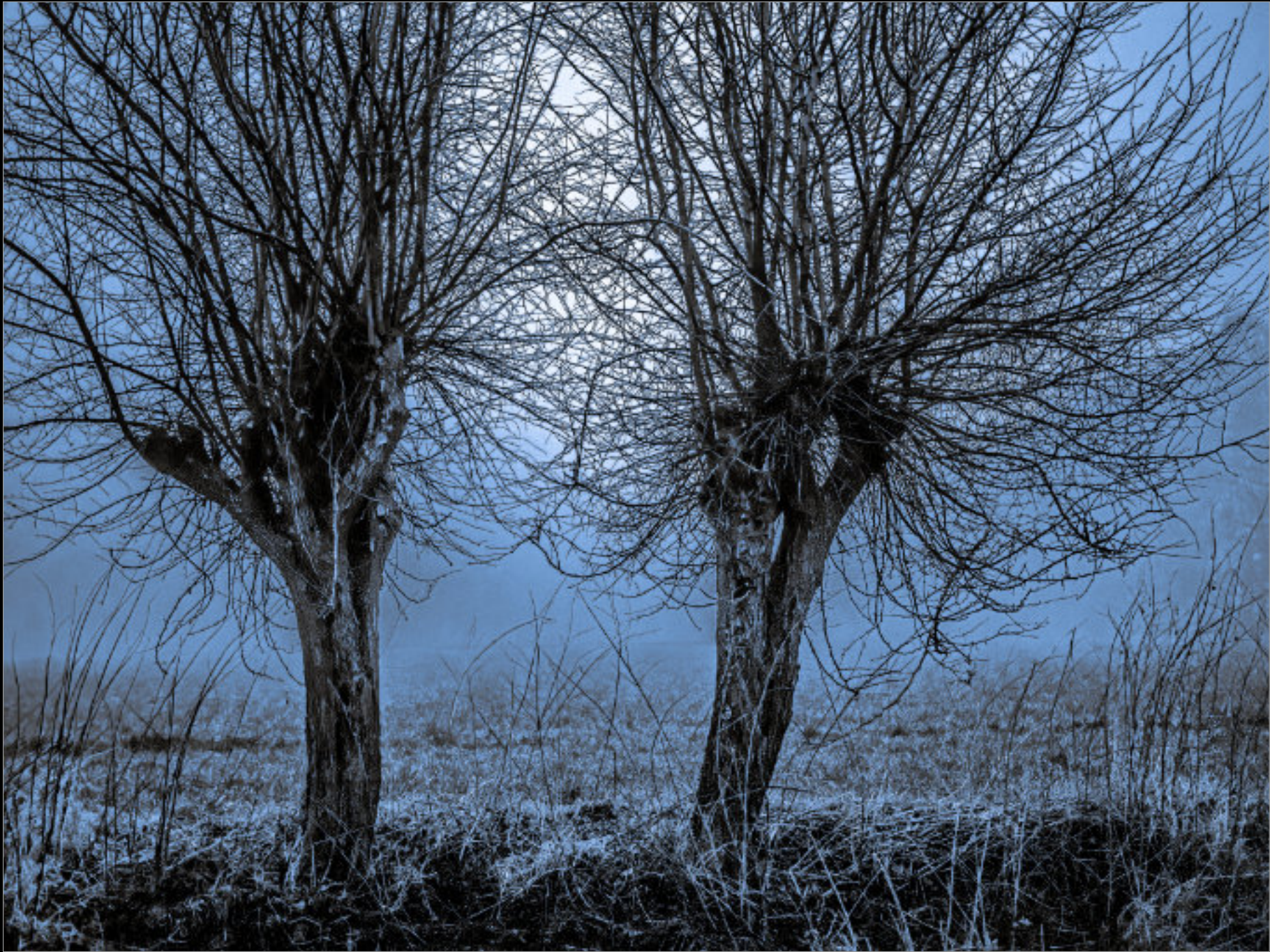
Geschneitete Heckenbäume im Herbstnebel