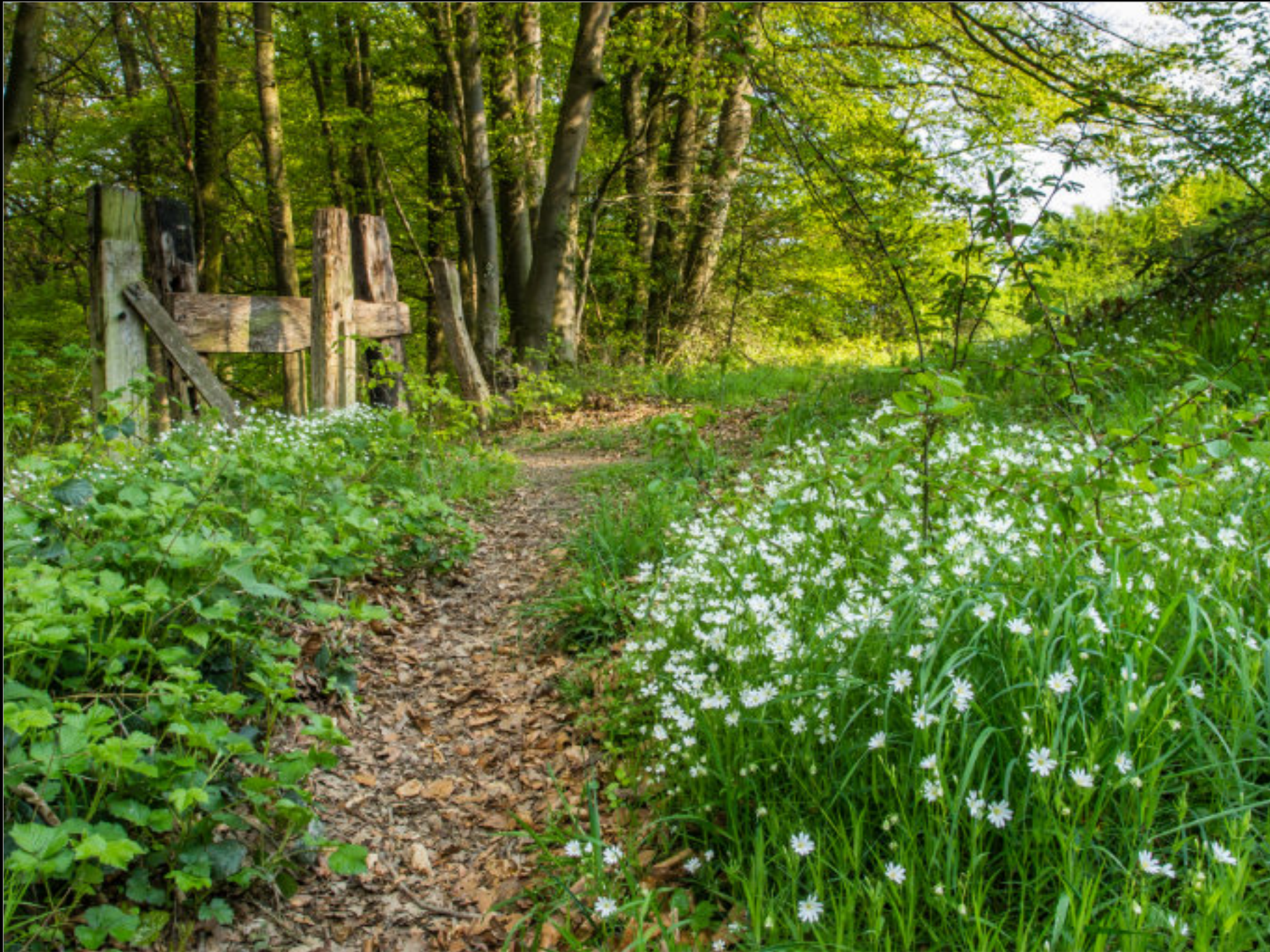
Vogelmiere an einem Wanderweg am Rand des Mühlenbachtals