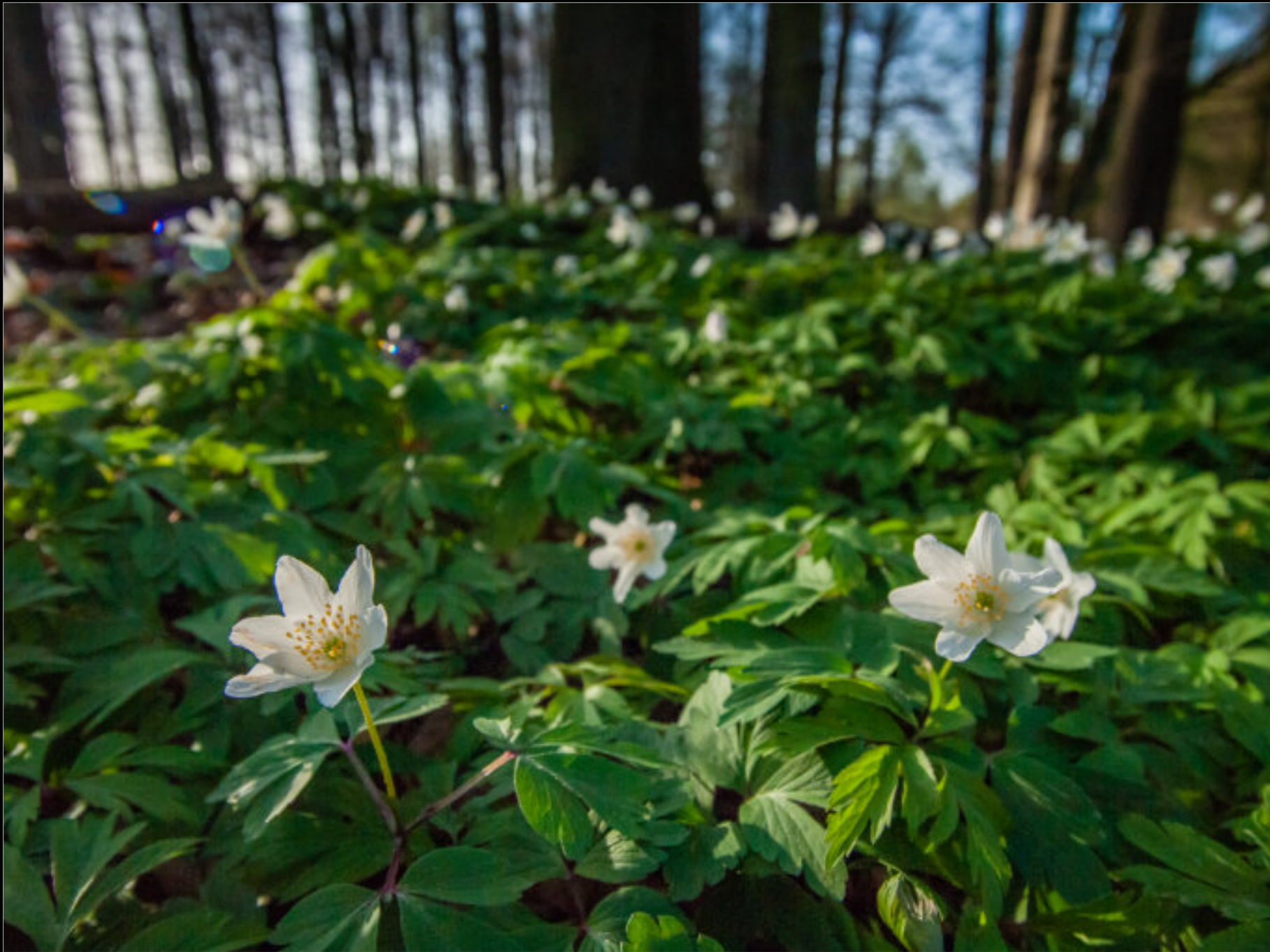
Buschwindröschen (Anemonen) sind in den Buchenwäldern des Köckerwaldes erste Frühlingsboten