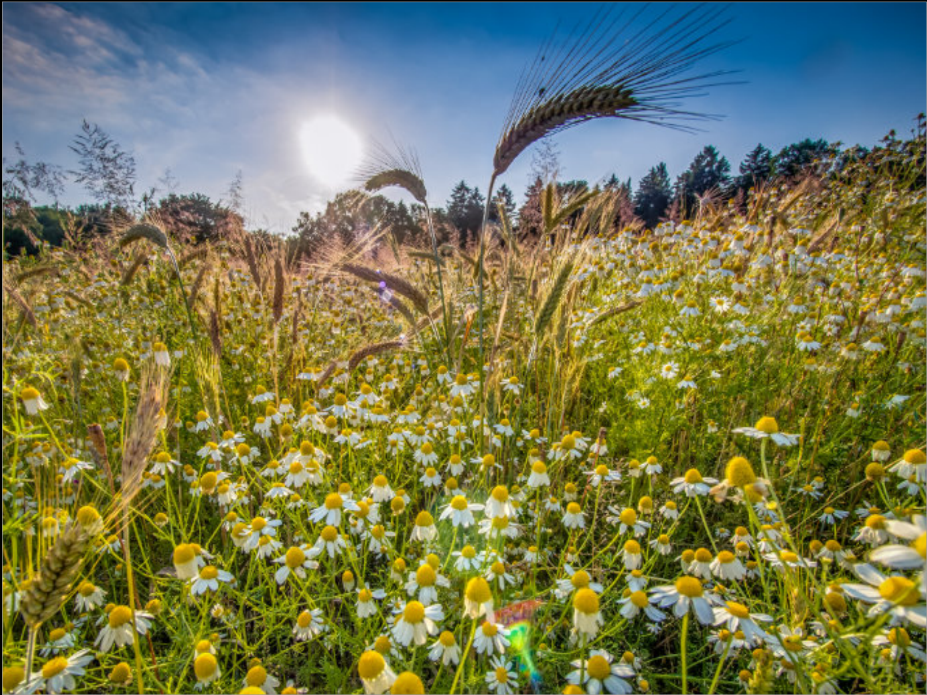
Hundskamille im Getreidefeld, Biolandbau