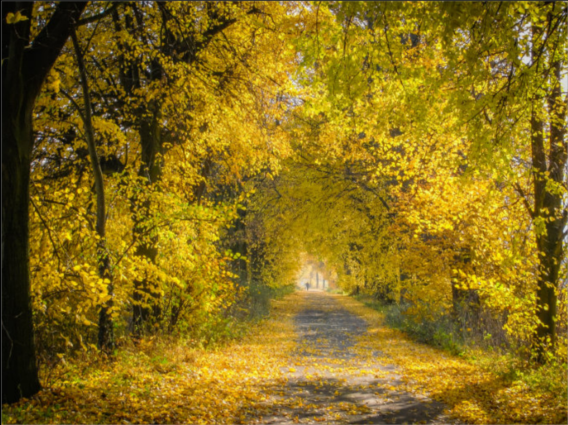
Parallel zur Jöllenbecker Straße verläuft eine Lindenallee