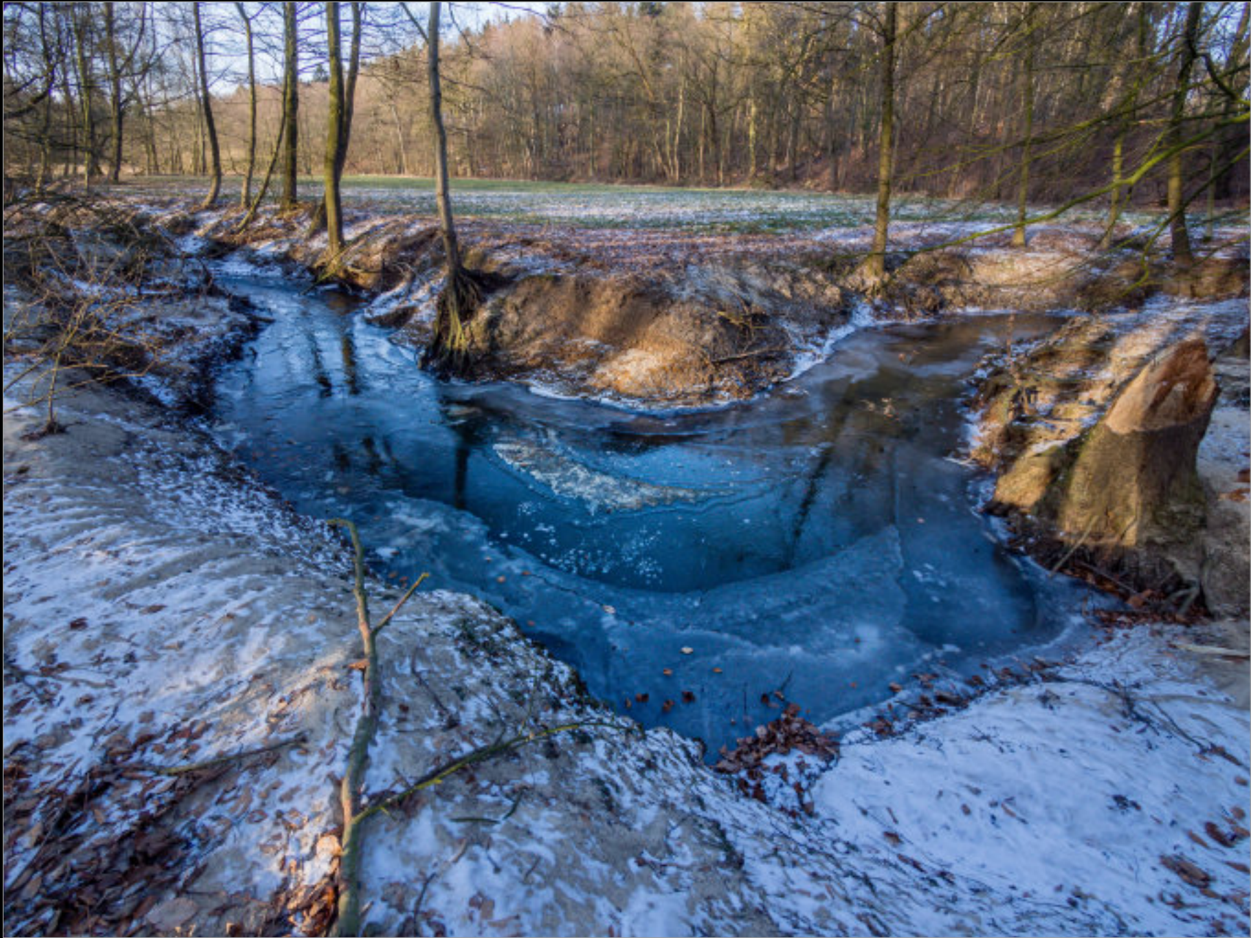
Zufrierender Beckendorfer Mühlenbach