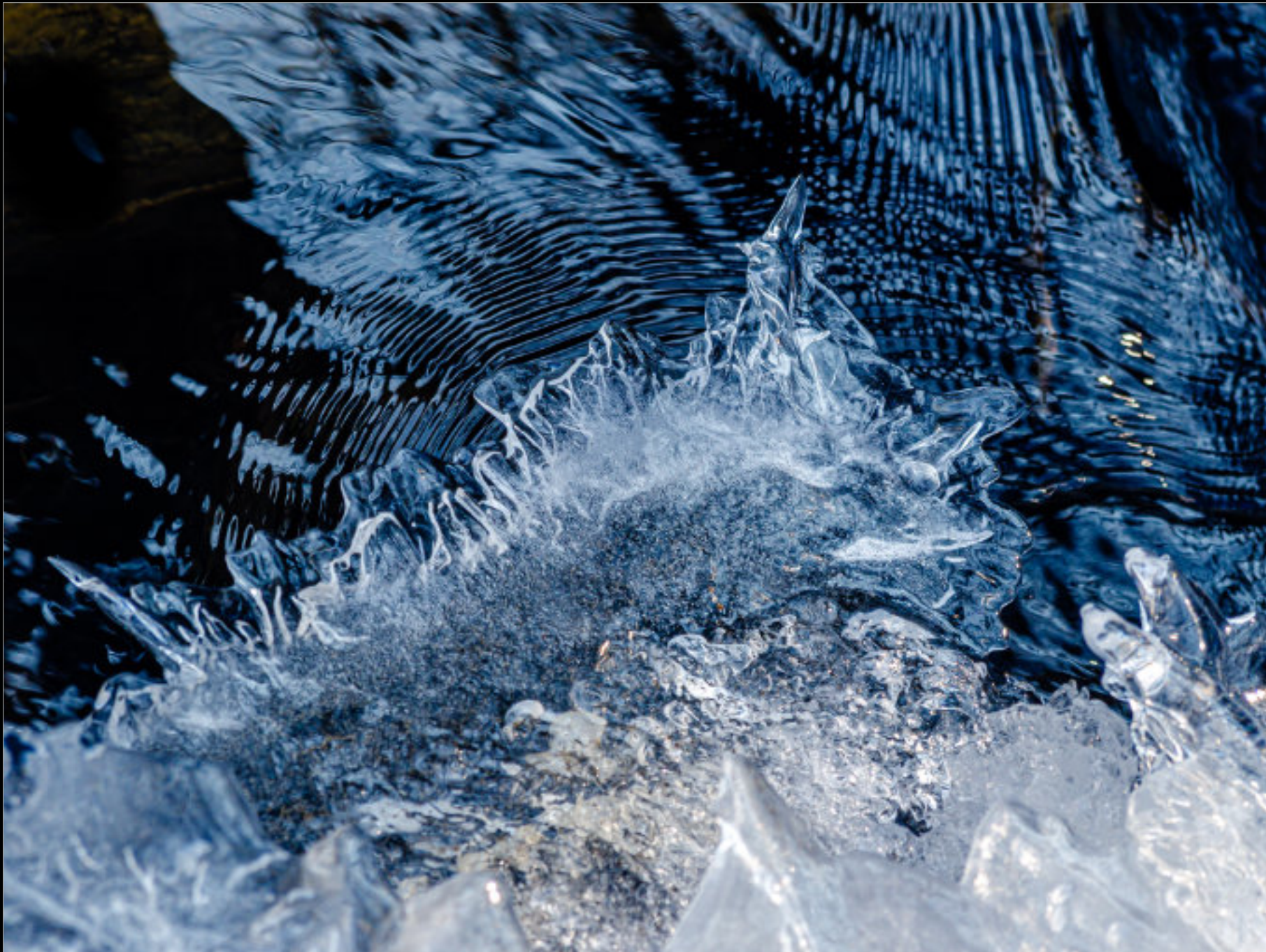
Eisbildung auf dem Beckendorfer Mühlenbach